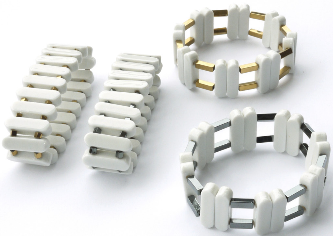
Bracelets Haie (à gauche) Bracelets Rail (à droite)

Porcelaine émaillée, hématite naturel ou doré, élastique