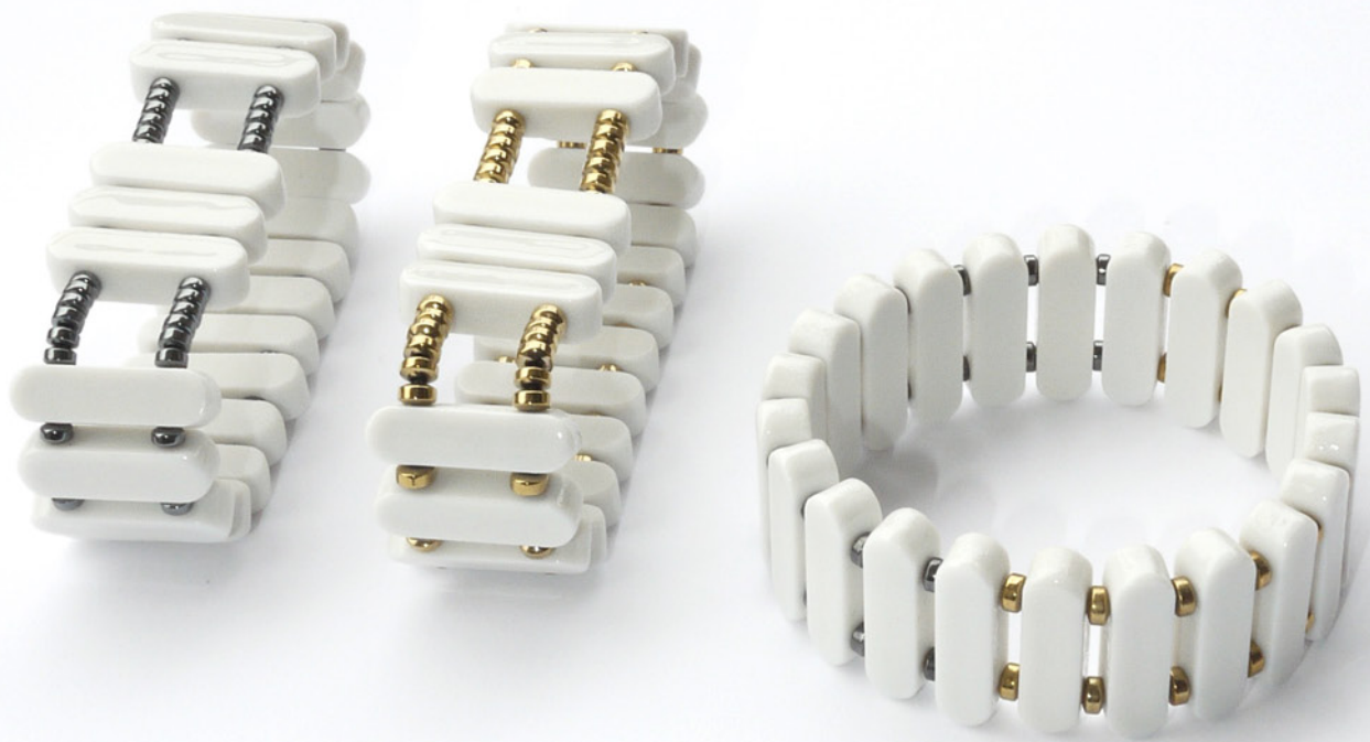
Bracelets Montre (à gauche) Bracelet Mix (à droite)

Porcelaine émaillée, hématite naturel ou doré, élastique