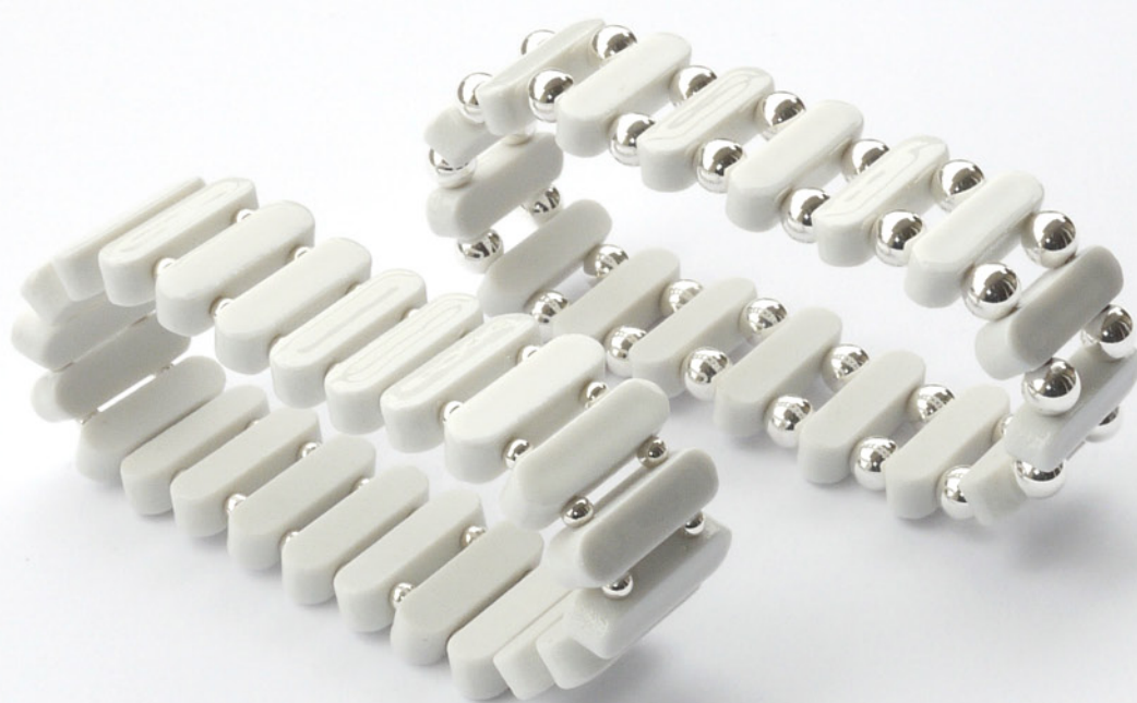
Bracelet Argent extra (arrière plan) Bracelet Argen (premier plan)

Porcelaine émaillée, argent 925, élastique